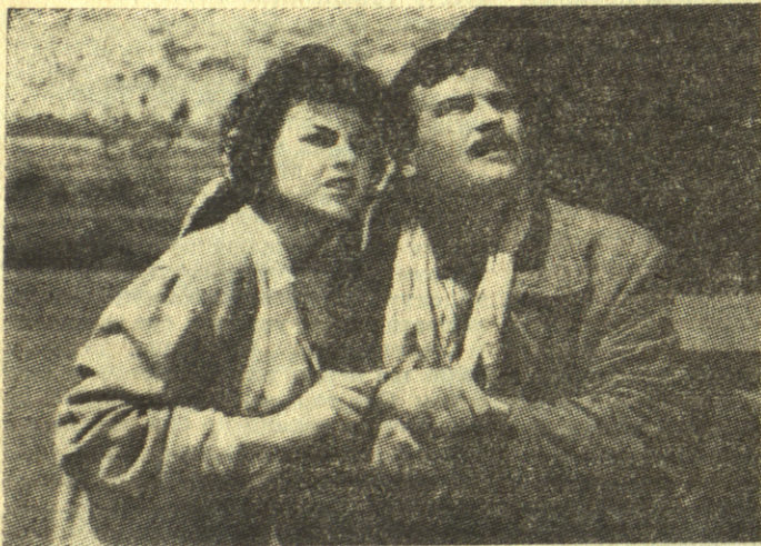
ЕШАЛОН ДОКТОРА М.

У свом раном детињству у доба када је тек признат као уметност, филм се састојао из акције. Кратке бурлеске биле су пуне журњава, куће су се рушиле, људи су падали са кровова и мостова, људи у аутомобилу гонили су људе у другом аутомобилу, а трећи су чекали једне и друге у заседи. Доцније је та акција, првобитно искључиво садржајна и спољашња, добила и свој формални израз, нарочито крупним планом и покретом камере, а затим и променљивим видним углом. Филм није више био филм о акцији, филм је сам постао акција.