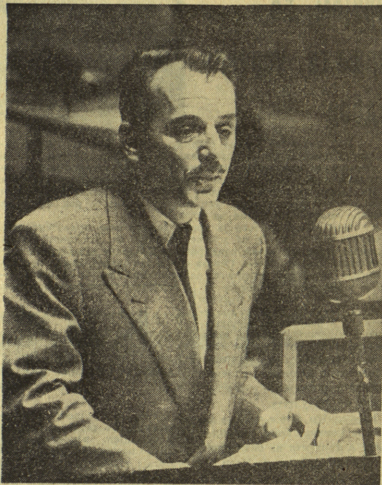
Drag Koča Popović, državni sekretar DSIP-a predvođiće jugoslovensku delegaciju na pretstojećem jubilarnom zasjedanju Generalne skupštine. Kao što je poznato ovom zasjedanje će se održati od 20—26 juna u San Francisku.