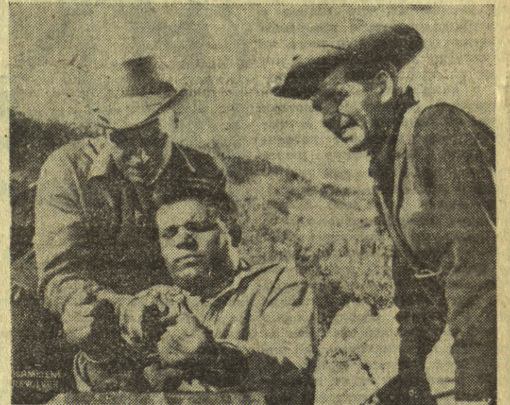
Доласи: „УСАМЉЕНИ РЕЗОЛВЕР“