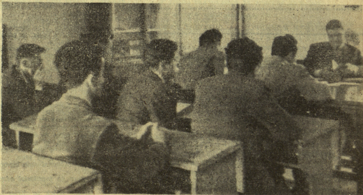
Испити су већ почели на свим факултетима. Резултати напора учињених на спремање испита огледаће се у „испитном месецу“.

На слици: група студената прва полаже испит.