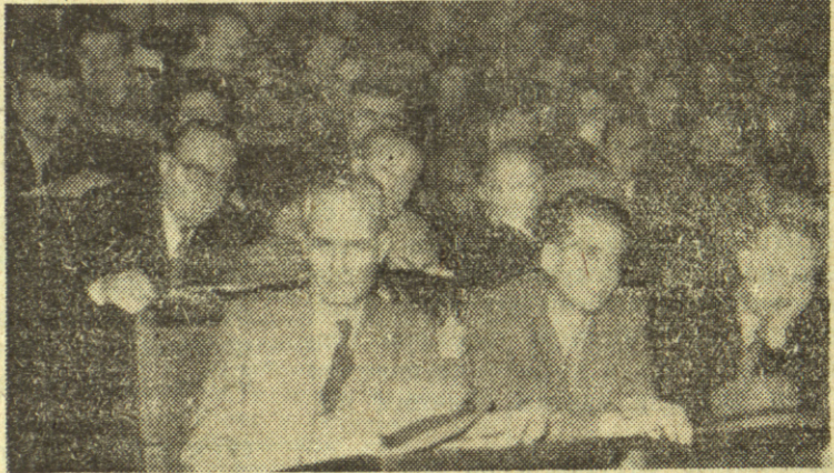
GOSTI NA UNIVERZITETSKOJ KONFERENCIJI SK.

Cini mi se da bi u ovom smislu veliku ulogu mogle da odigraju studentkinje na našem Univerzitetu i pored toga što kod nas vlada mišljenje da su drugarice neaktivne i da ih je vrlo teško povući u akciju. Prošlogodišnje