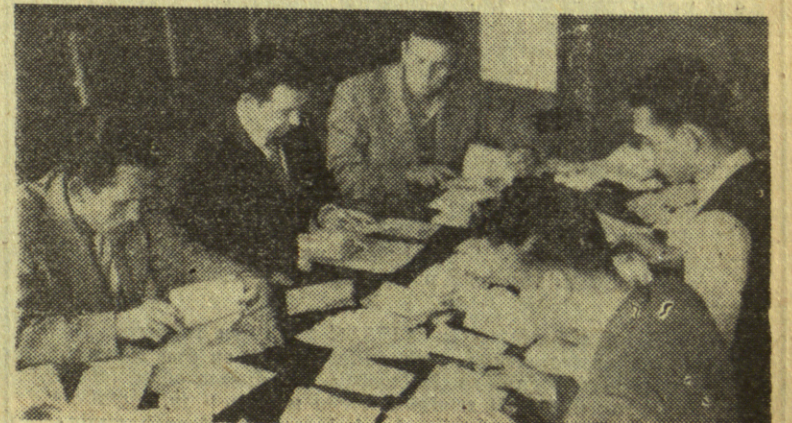
ПОСЛЕ ВЕЛИКОГ БРОЈА ПРИЈАВЉЕНИХ ИСПИТА — СТВАРА СЕ РАСПОРЕД ПОЛАГАЊА

Povoljne okolnosti pod kojima se ona održava i koje su u znaku učvršćenja mira u svetu i iznalaženja oblika i mogućnosti za saradnju sa različitim unutrašnjim uređenjima van svakih blokova — daju nam za pravo kad očekujemo da će i na ovoj konferenciji doći do izražaja pozitivne tendencije za zblizavanjem svih studenata u svetu. To bi bio značajan momenat u razvoju međunarodne studentske (Nastavak na 3 str.)