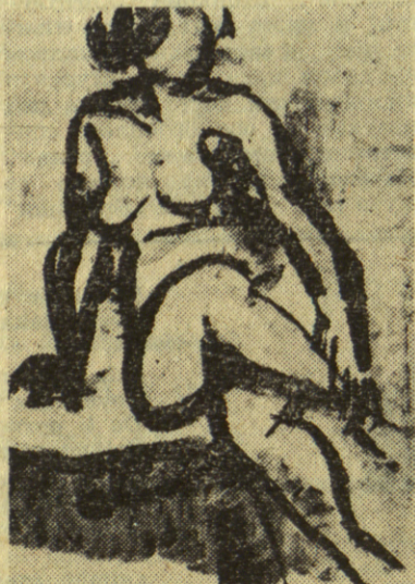
МОМА МАРКОВИЋ: Акт