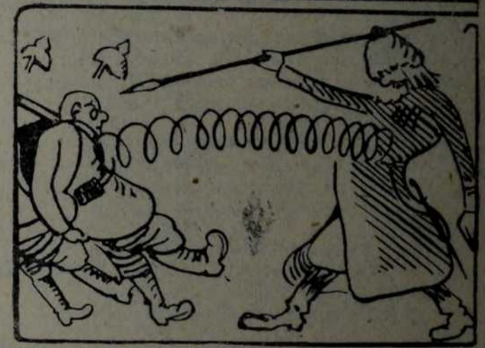
„LE RIF“ ПАРИЗ