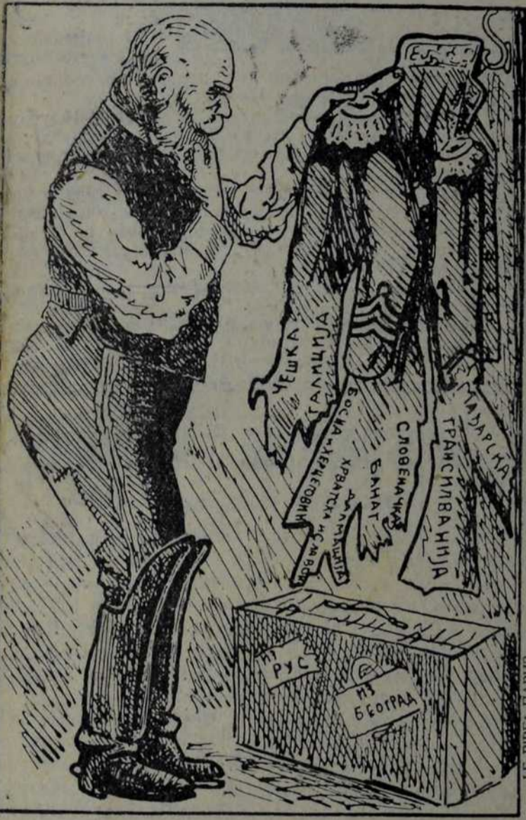
— У Јулу сам га направио, и гледај шта се до Ускрас начини од њега! А, сви хвале бечке швајцаре!