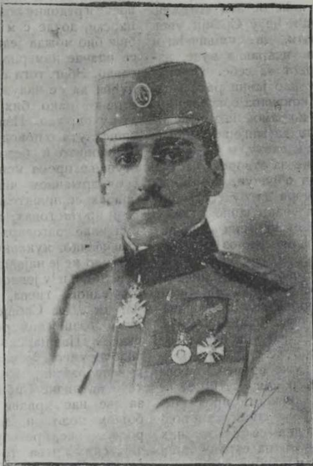
Њ. Краљ. Височанство Престолонаследник АЛЕКСАНДАР

Рукописе и претплату треба слати: Уредништву ВЕЧЕРЊИХ НОВОСТИ БЕОГРАД, Космајска ул. бр. 28.