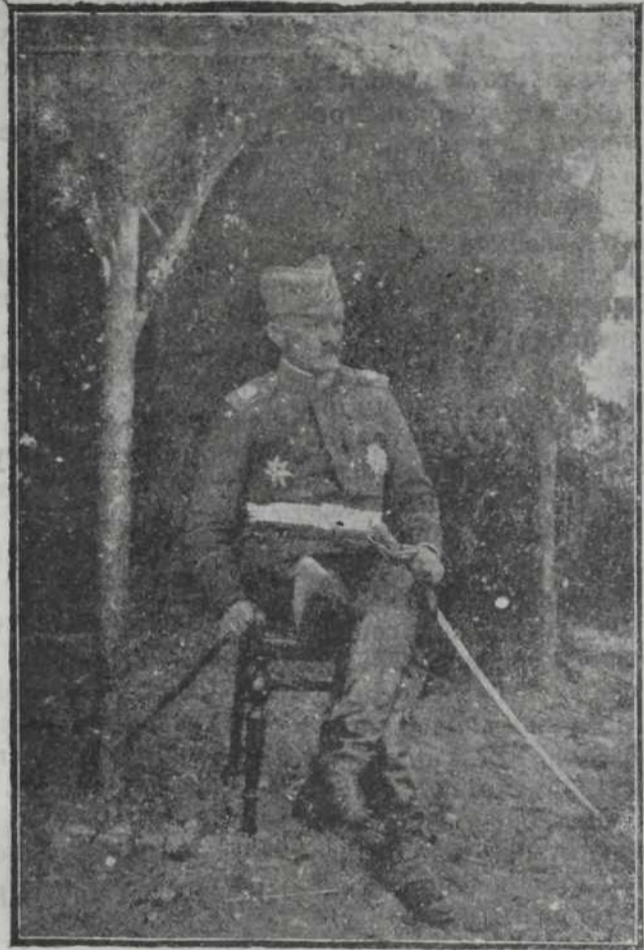
Војвода ЖИВОЈИН Р. МИШИЋ.

Наследник српскога престола, будући краљ Југославије Александар , рођен је 4. децембра 1889. године, као син тадањег кнеза Петра Карађорђевића и кнегиње Зорке, кћери кнеза Црне Горе Николе Петровића—Његоша. У његовим жилама тече чиста српска крв, јер су његови претци и по оцу и по мајци чисти Срби и знаменити људи. Краљ Петар је унук ослободиоца Србије неумрлога хероја Карађорђа а син кнеза српског Александра; мајка краља Петра Персида била је кћи војводе Јеврема, а унука једног од најчувенијих војсковођа и државника из Карађорђевог устанка, Јакова Ненадовића. Мати пок. кнегиње Зорке, кнегиња Милена, ћерка је војводе чевског и сердара Петра Вукотића.