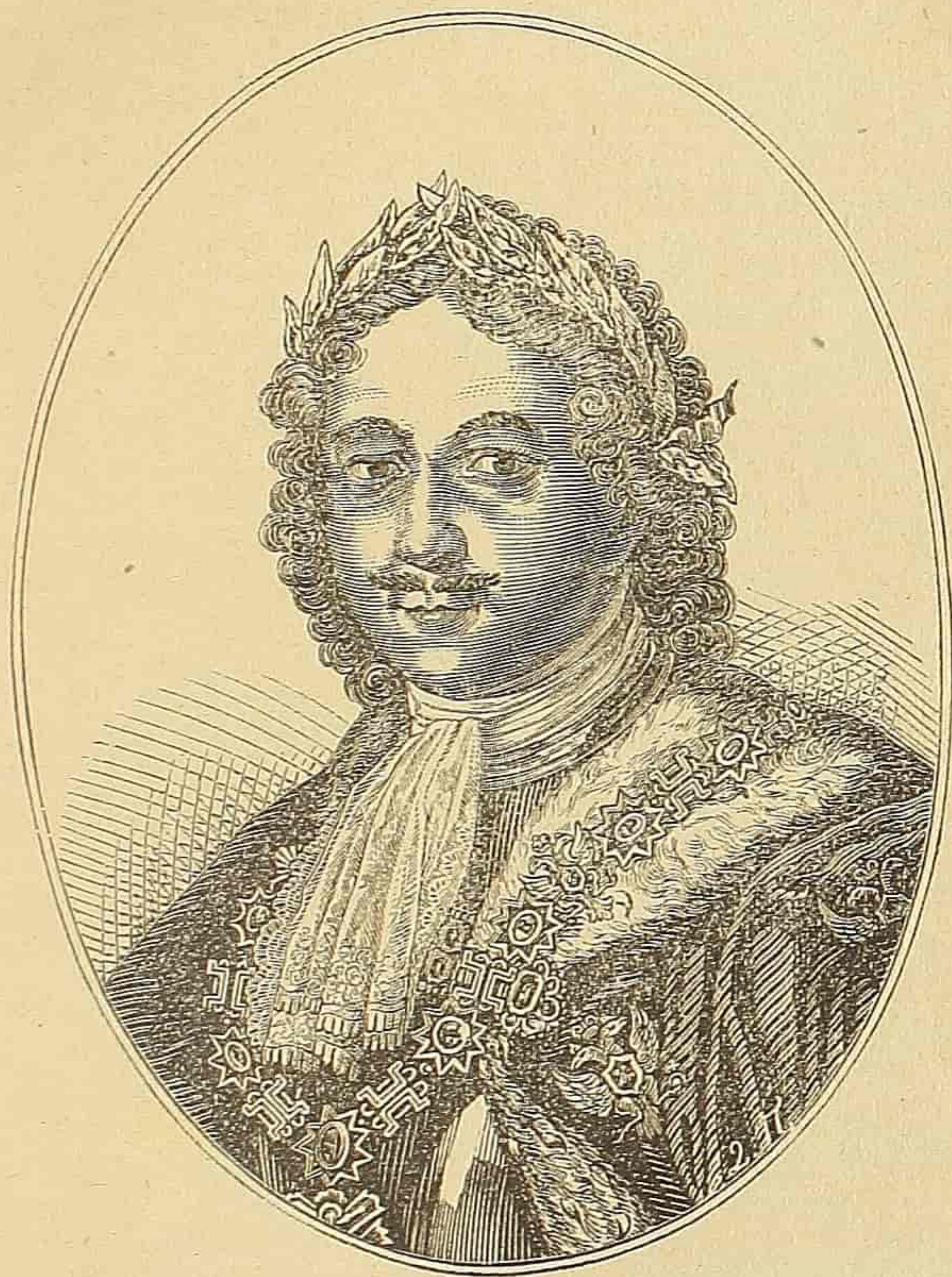
Велики Петар руски цар.