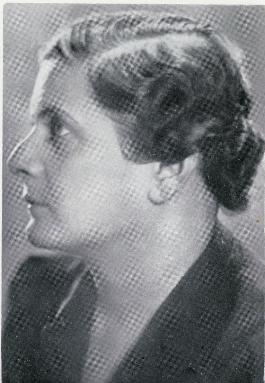
Вера Кићевац, 1938 г.