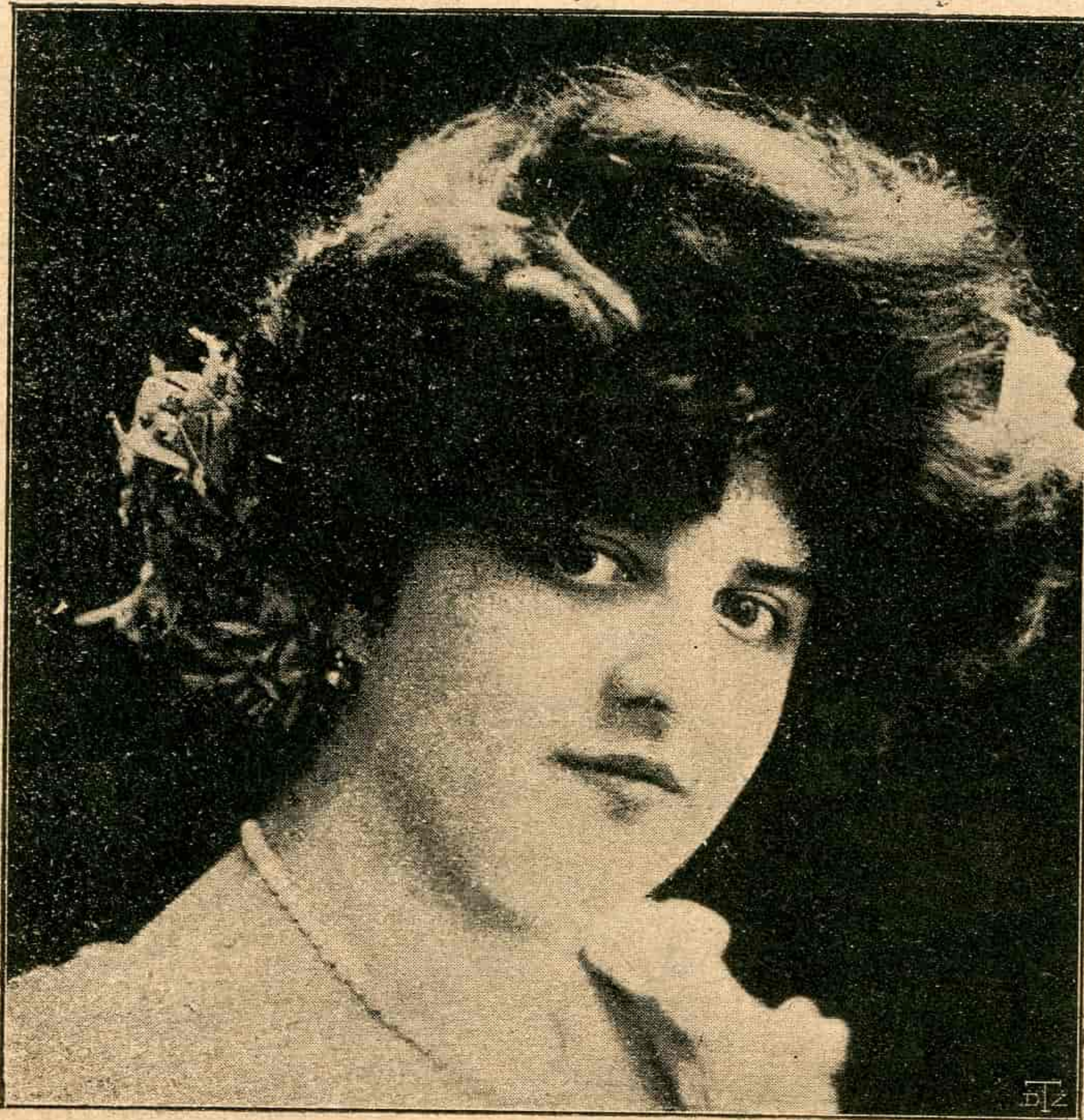
Маргарета Фехим Паша.